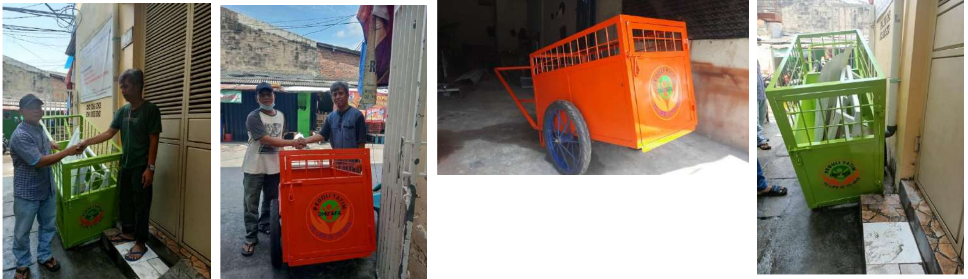
Pengadaan Gerobak Sampah bagi Masyarakat Tugu Koja Jakarta Utara.