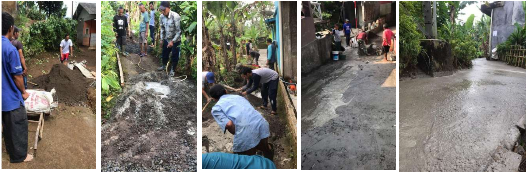
Perbaikan Akses Jembatan dan Jalan seluas 80 meter bagi Masyarakat Desa Banjarwangi Ciawi Kb. Bogor.