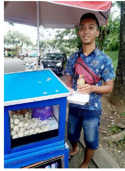
Jum'at berkah diselenggarakan Tiap pekan di wilayah Bogor dan Jakarta Utara