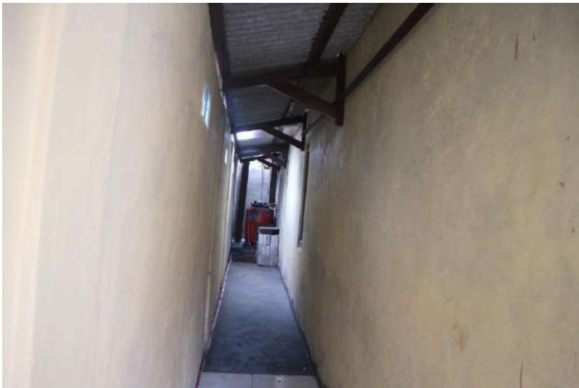
Ruang Gudang dan Tiang Torn Air