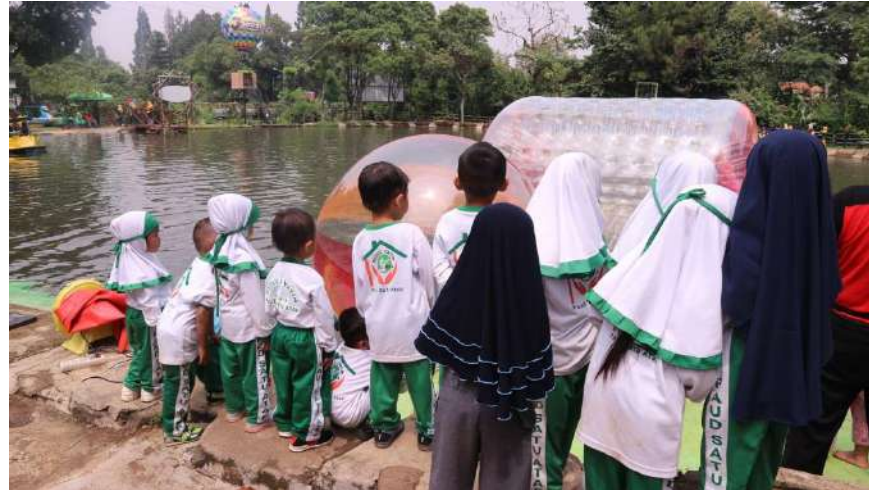
Rihlah Paud Satu Atap Bogor dan PYD Koja di JBOUND