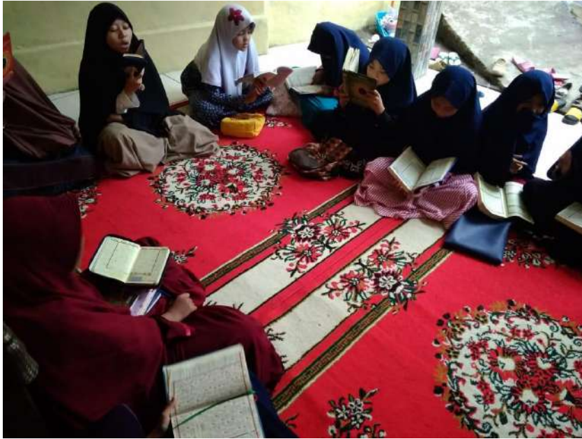
Santri Asrama Banat Cabang Bogor