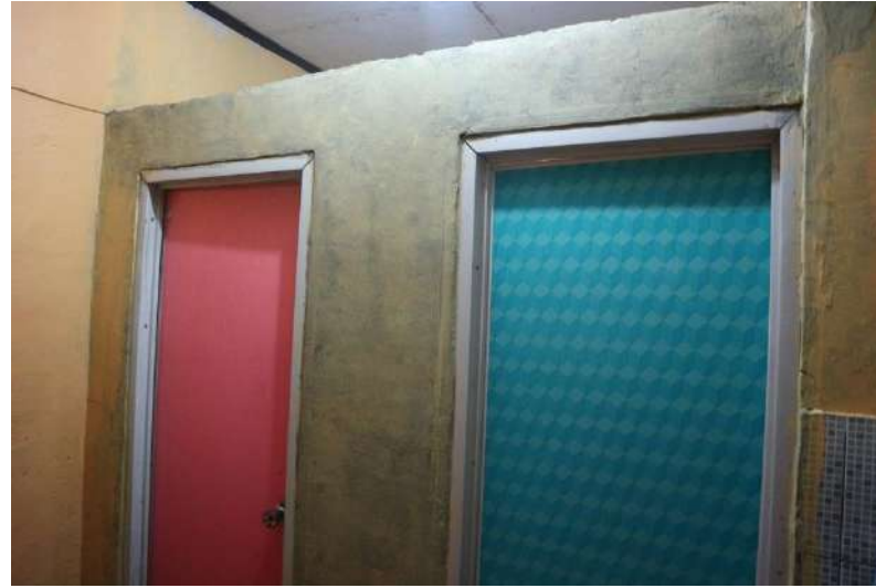
Penambahan Kamar Mandi