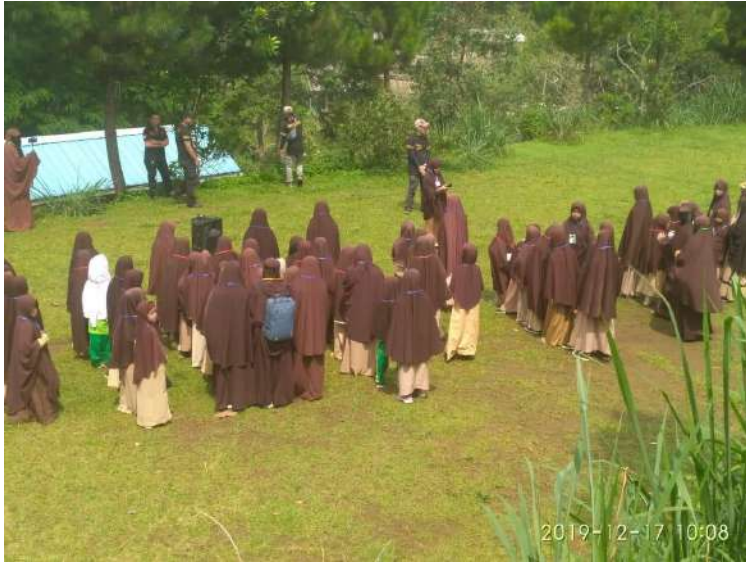
PRAMUKA DI PUNCAK BOGOR