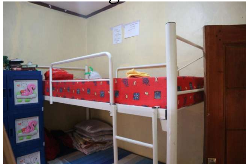
Bagian dari Kamar Santri