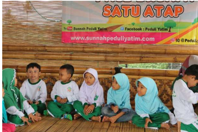
Rihlah Paud Dhuafa Taman Herbal Jaksel