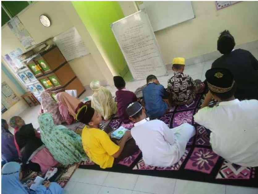
Santri PYD Cabang Lombok