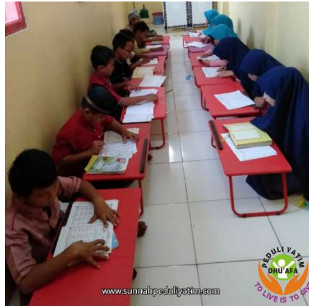
PYD CAB. KOJA