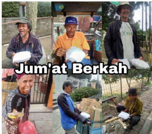
Jum'at Berkah Sbskin www.sunnahpeduliyatim.com