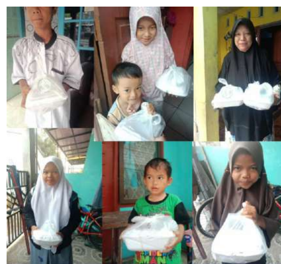
Berbagi Makanan di Jum'at Berkah