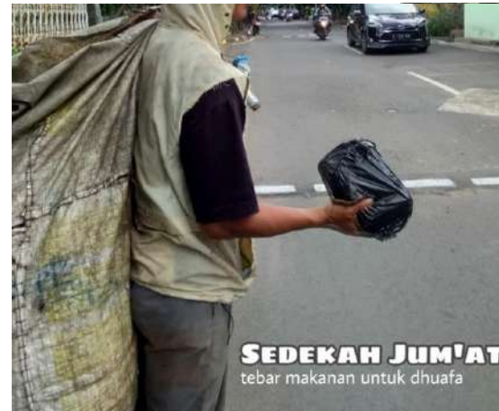
SEDEKAH JUM'AT tebar makanan untuk dhuafa to live is to give www.sunnahpeduliyatim.com