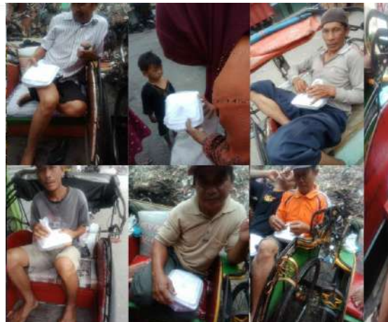
to live is to give www.sunnahpeduliyatim.com