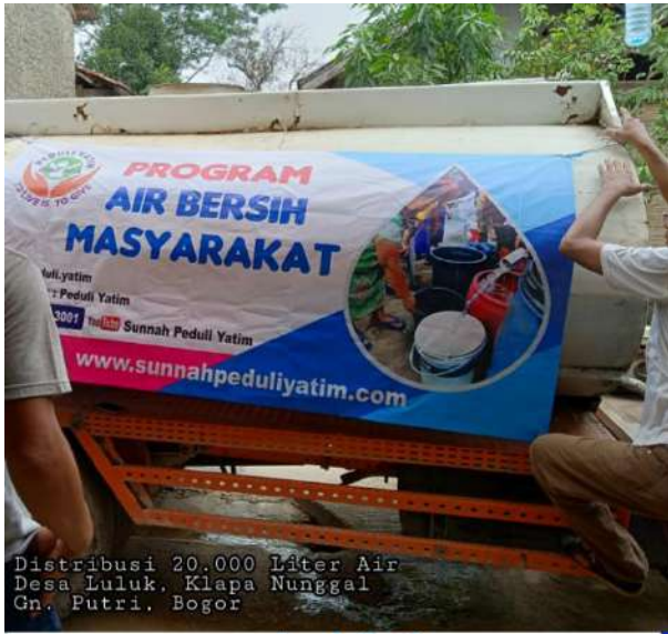
Distribusi 20.000 Liter Air Desa Luluk, Klapanunggal Gn. Putri, Bogor