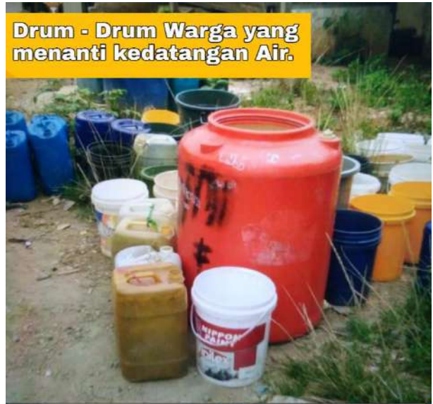
Drum - Drum Warga yang menanti kedatangan Air.