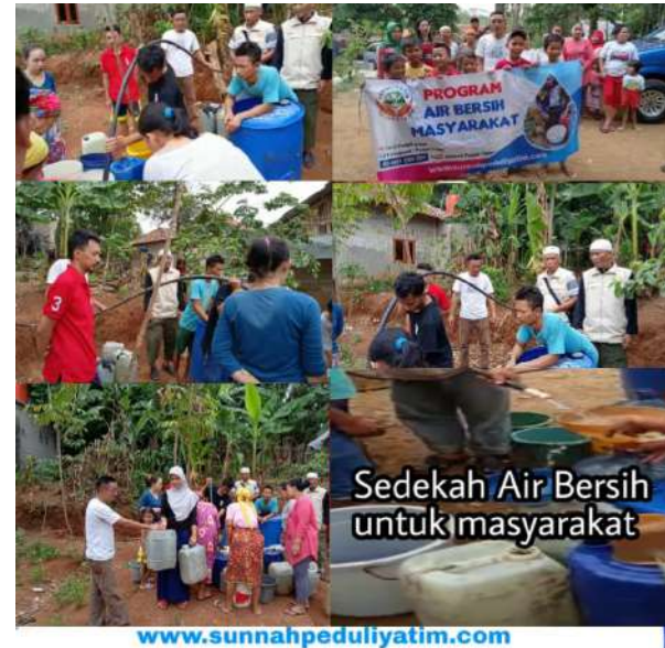
Sedekah Air Bersih untuk masyarakat