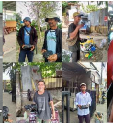
to live is to give www.sunnahpeduliyatim.com