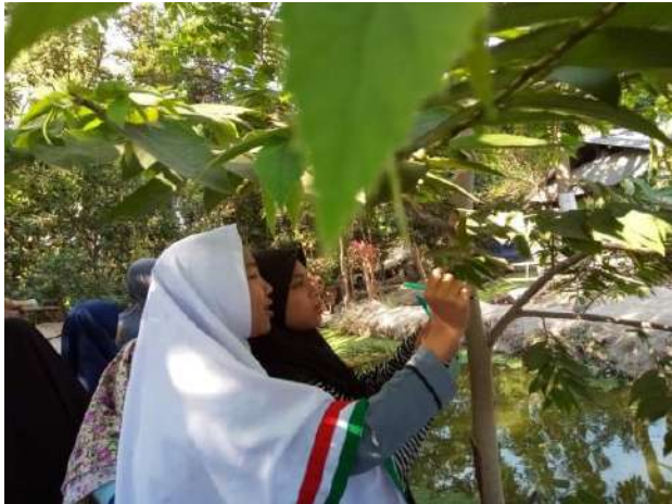
Observasi Alam PYD LOMBOK, NTB