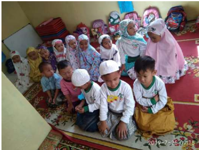
Praktek Shalat Paud