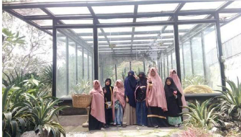
wisata Edukasi Kebun Raya PYD Bogor, Jawabarat