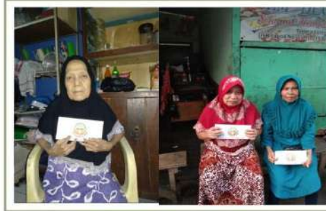
ZAKAT untuk JANDA DHUAFA