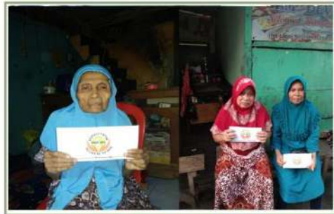
ZAKAT untuk JANDA DHUAFA