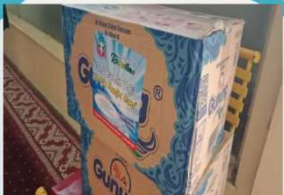
Sedekah Air Ta'jil Ramadhan untuk Masjid Jami'

f Peduli Yatim 0821 2300 3001 Peduli.Yatim