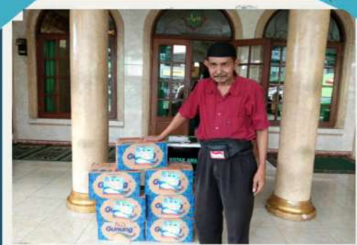
#Fidyah Kaum Muslimin