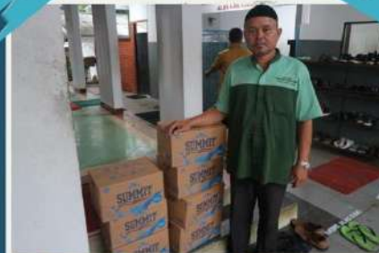
Sedekah Air Ta'jil Ramadhan untuk Masjid Jami'

f Peduli Yatim 0821 2300 3001 Peduli.Yatim