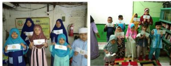
# Santunan Lebaran Yatim