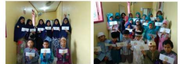
# Santunan Lebaran Yatim