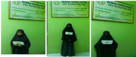
# Santunan Lebaran Yatim