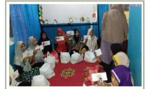
ZAKAT untuk JANDA DHUAFA