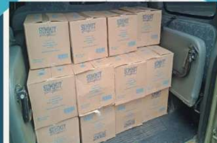
Sedekah Air Ta'jil Ramadhan untuk Masjid Jami'

f Peduli Yatim 0821 2300 3001 Peduli.Yatim