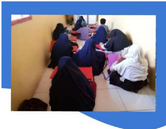
RUMAH PEDULI YATIM KOJA JAKARTA UTARA