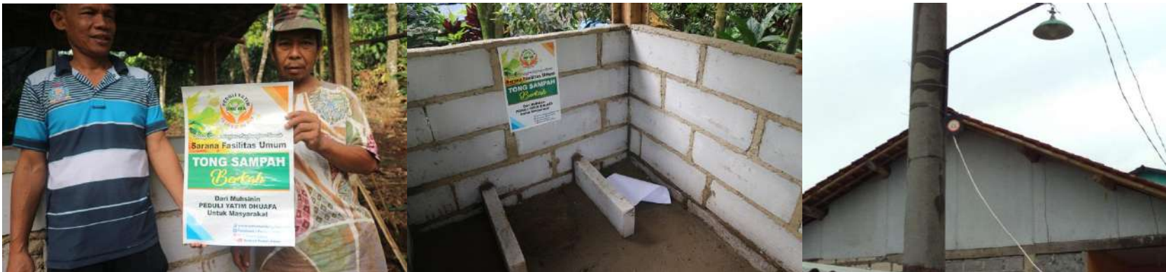
PEMBUATAN SAUNG PEMBAKARAN SAMPAH DAN PENERANGAN JALAN MASYARAKAT SUKAMANTRI TAMANSARI BOGOR