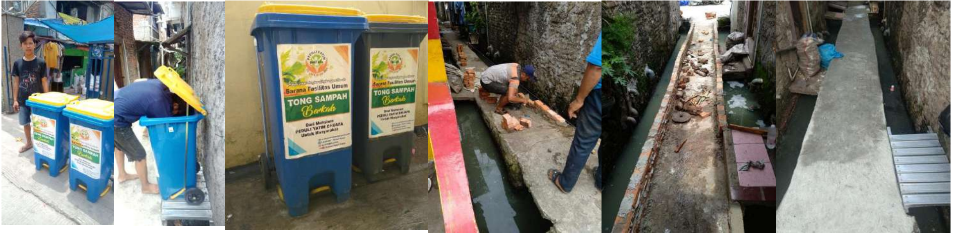
TONG SAMPAH DAN PENINGGIAN JALAN GANG ATASI BANJIR UNTUK FASILITAS MASYARAKAT KOMPLEK UKA KOJA JAKARTA UTARA