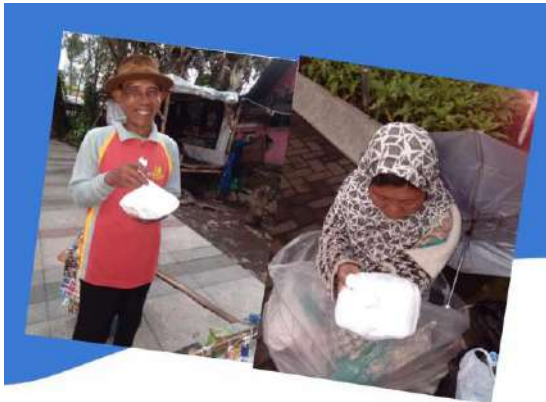
Jum'at Berkah www.sunnahpeduliyatim.com