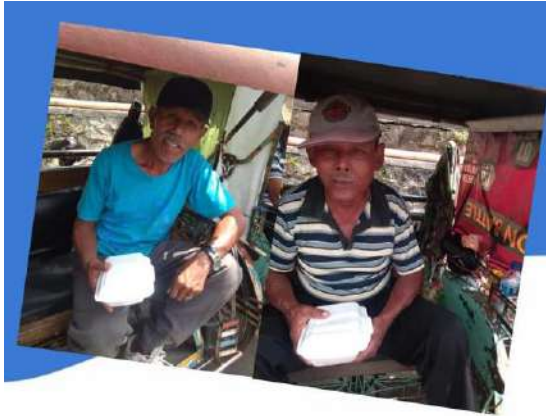
Jum'at Berkah www.sunnahpeduliyatim.com