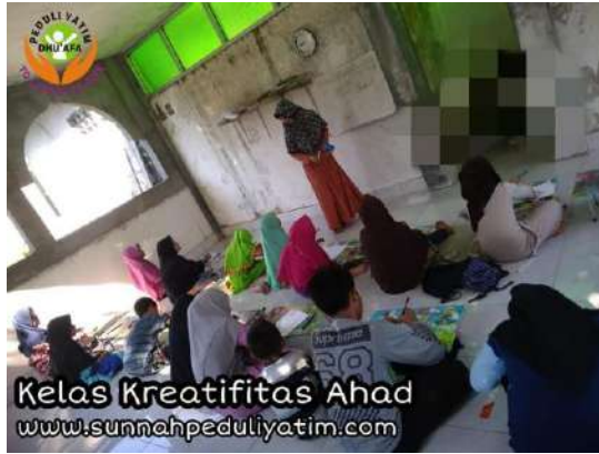
RUBEL SATU ATAP LOMBOK