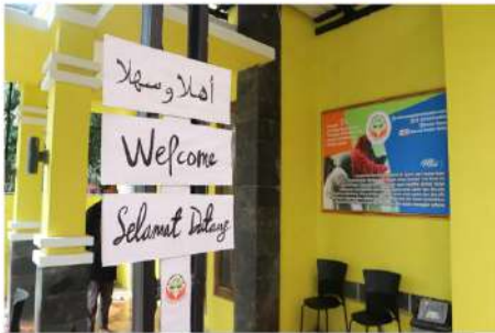
Grand Opening Sekretariat Pusat Peduli Yatim Dhu'afa

Alamat Sekretariat : Jl. Sadar Raya No.E36 Ciganjur, Jagakarsa Jakarta Selatan