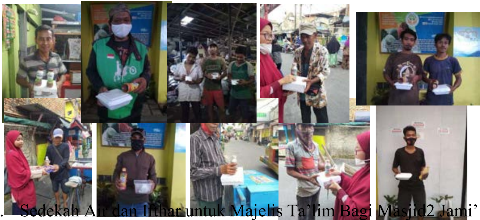
3. Sedekah Air dan Ifthar untuk Majelis Ta'lim Bagi Masjid2 Jami'.