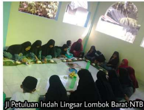
Jl Petuluan Indah Lingsar Lombok Barat NTB