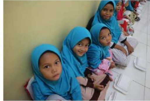
Jl. Komplek Uka No. 1 Koja Jakarta Utara