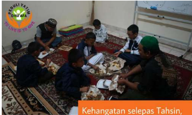
Kehangatan selepas Tahsin, Bahagia memang Sederhana.