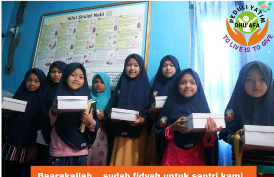
Baarakallah.. sudah fidyah untuk santri kami