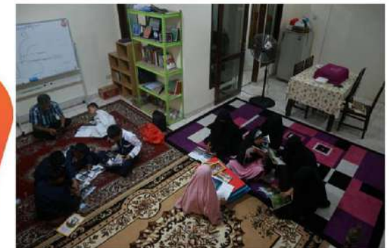
Jl. Raya Pondok Bitung Desa Sukamantri Tamansari Bogor