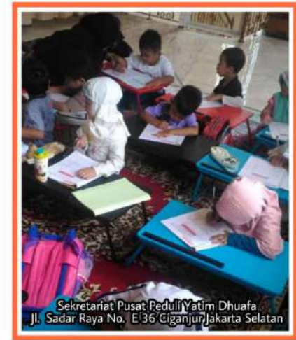
Sekretariat Pusat Peduli Yatim Dhuafa Jl. Sadar Raya No. E 36 Ciganjur Jakarta Selatan