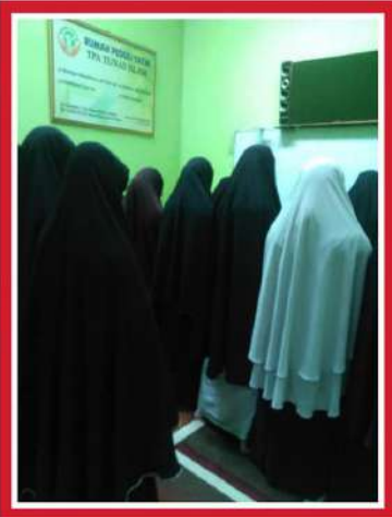
Rumah Peduli Yatim Dhuafa Kalisari Jakarta Timur jumlah santri : 52 santri Jl. Gandaria I gang Somad Modo Pekayon Jakarta Timur