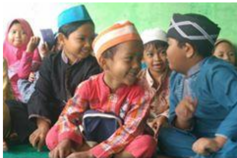
Character Building #SyukurHadirkanBahagia