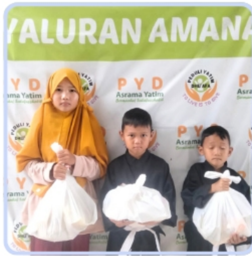
Zakat untuk Santri