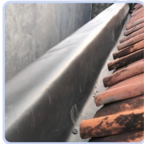
Perbaikan Atap Toilet Asrama