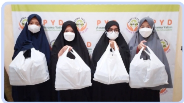
Santri Peduli Yatim Dhuafa Cabang Jakarta Selatan