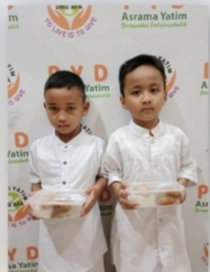
Pembagian Nasi Box untuk Santri Peduli Yatim Cabang Jakarta Selatan