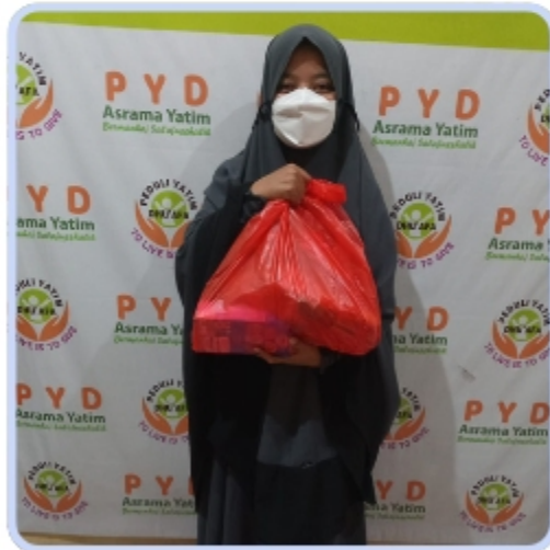
Zakat untuk Guru