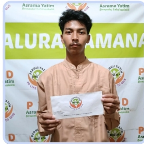
Santri TPQ Peduli Yatim Dhuafa Cabang Koja Jakarta Utara