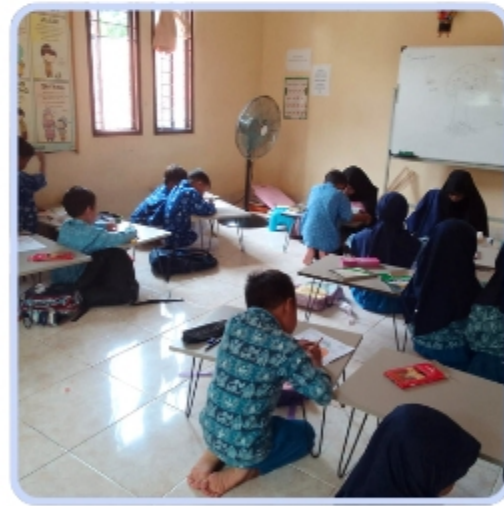
Paud Satu Atap Rabbani Jakarta Selatan