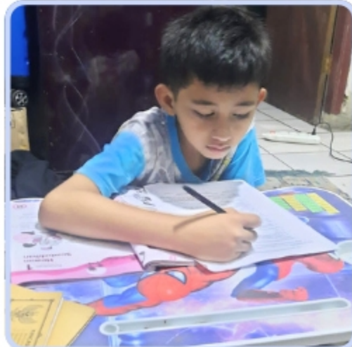
Santri Peduli Yatim Dhuafa Cabang Bogor