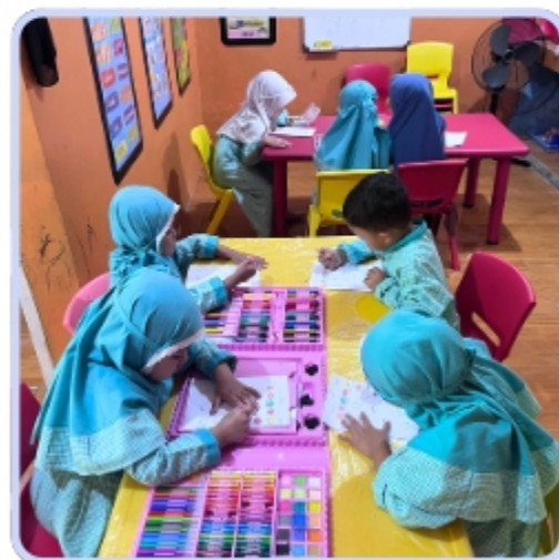
Paud Satu Atap Bogor