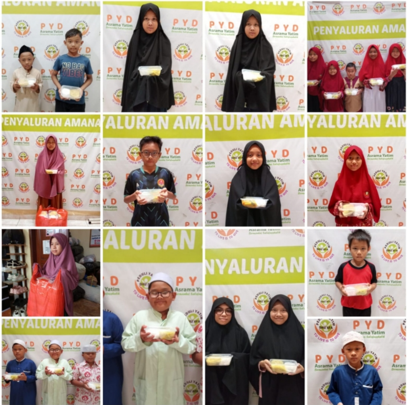
Pembagian Nasi Box untuk Santri Peduli Yatim Cabang Jakarta Selatan