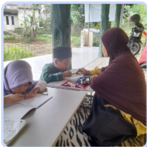
Santri Peduli Yatim Cabang Cigombong Bogor