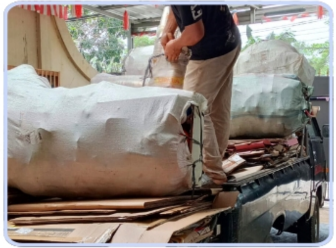
Mitra Resmi Bank Sampah DKI Jakarta SK Lurah Ciganjur ; No.50 th. 2025