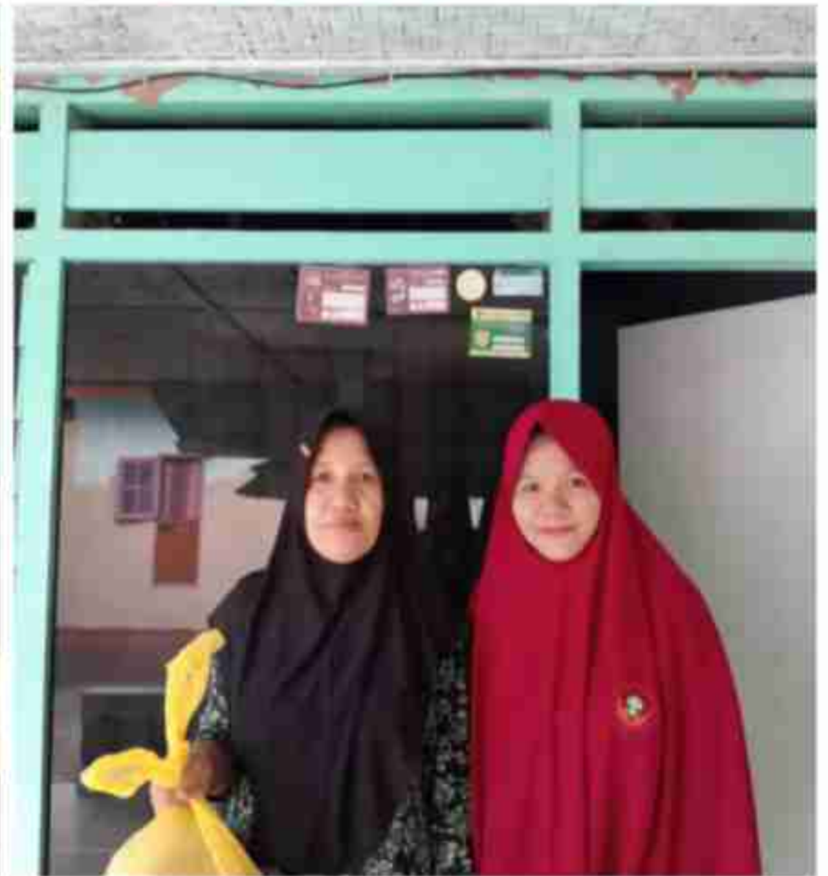
Pembagian Paket Sembako Untuk Wali Santri PYD dan Janda Dhuafa Masyarakat