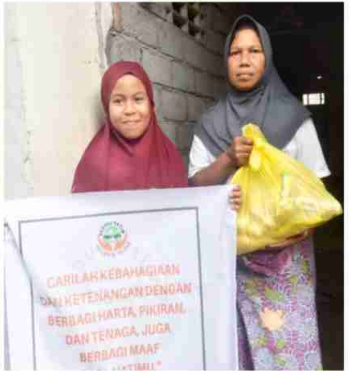
Pembagian Paket Sembako Untuk Wali Santri PYD dan Janda Dhuafa Masyarakat