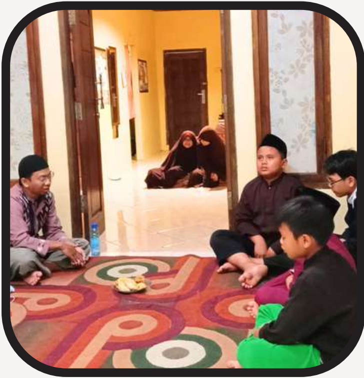
Kegiatan kajian Islam di Asrama Santri Yatim Bogor