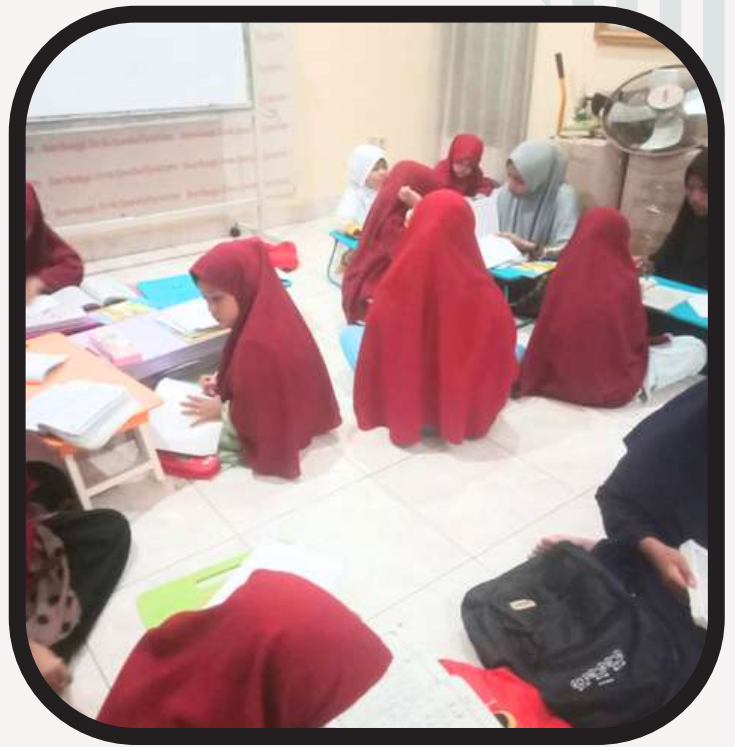
Terlihat santri giat mengaji dan menuntut ilmu dalam kegiatan TPQ di Sore hari