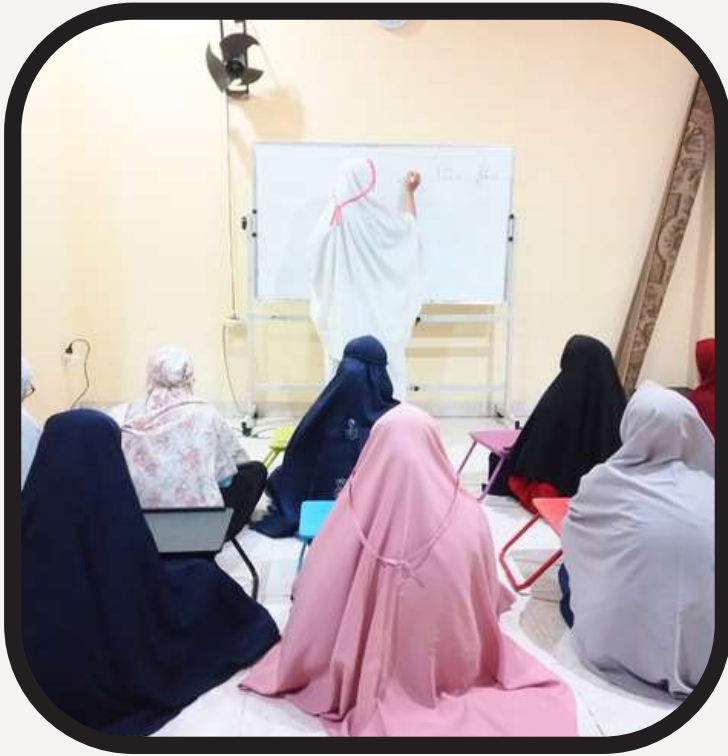
Santri menunjukkan antusias belajar bersama Musyrifah di Asrama PYD Jaksel