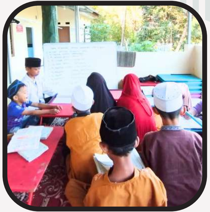
Semangat belajar mengaji di Asrama PYD Caringin Bogor