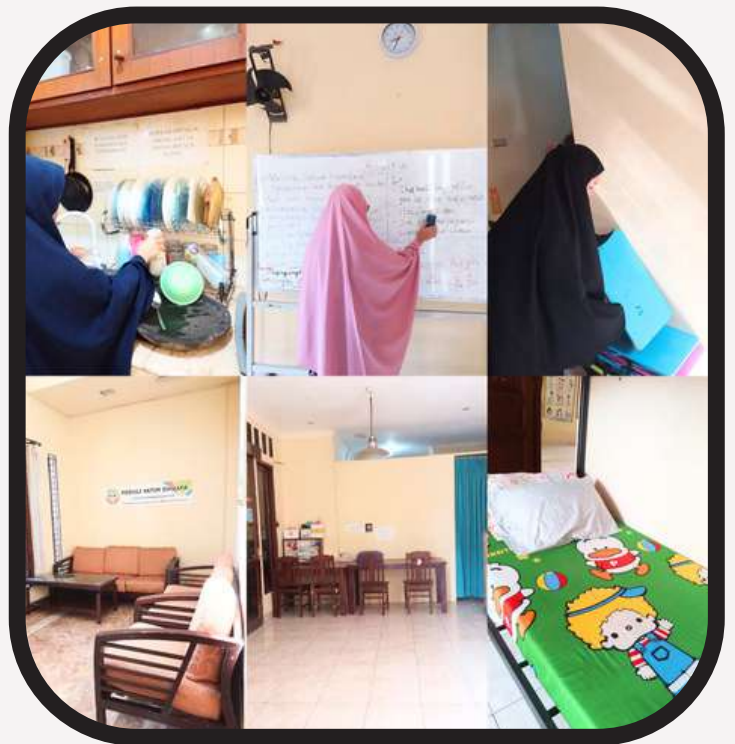
Santri sedang memberikan ruangan asrama dengan penuh semangat dan menunjukkan kerja sama terhadap kebersihan