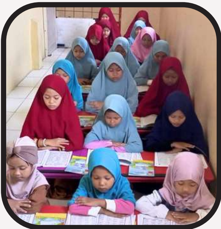
Anak Santri PYD Koja tengah menuntut ilmu belajar mengaji pada kegiatan TPQ sore hari