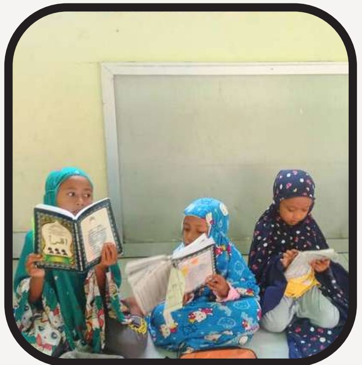
Belajar Iqro Santri PYD Lombok